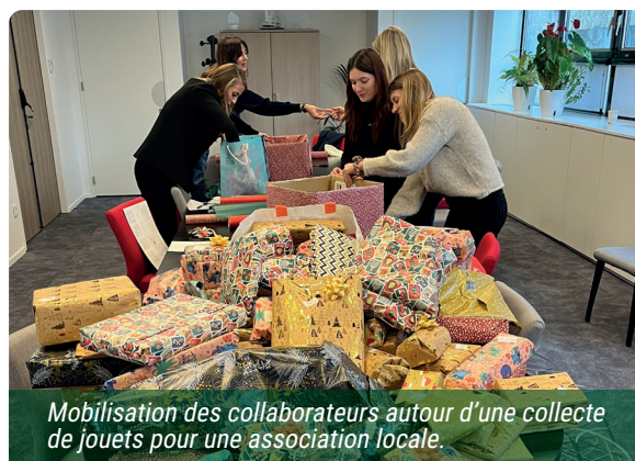
Mobilisation des collaborateurs autour d'une collecte de jouets pour une association locale.